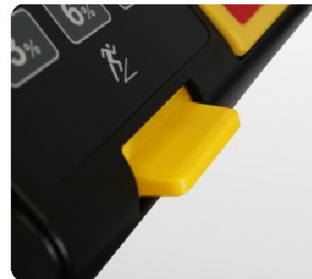
Трекпад для удобной регулировки скорости и угла наклона