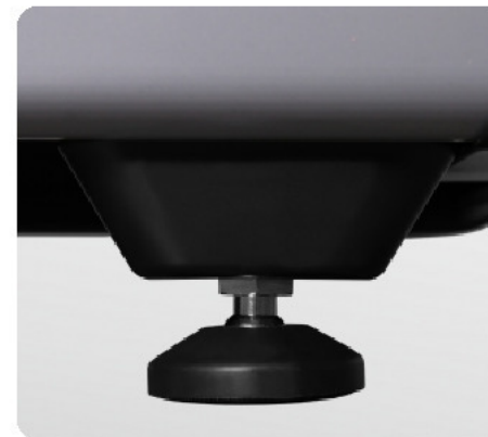
Компенсаторы неровностей пола