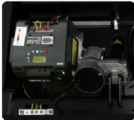
Инвертер Siemens Sinamics V20