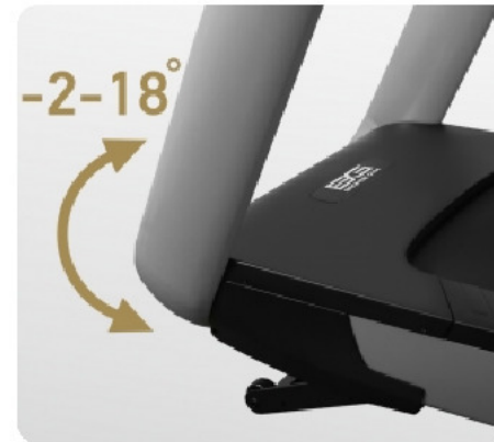
Автоматически изменяемый угол с отрицательным углом наклона от -2 до 18%