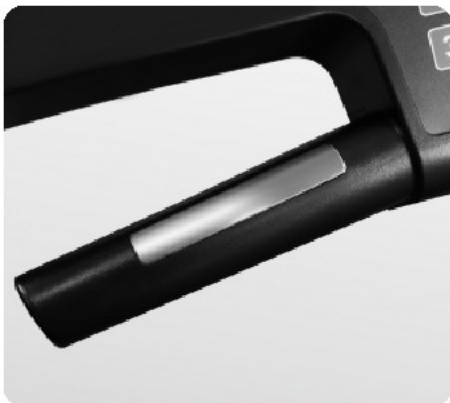
Сенсорные датчики пульса