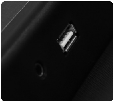
USB-выход для подзарядки мобильных устройств