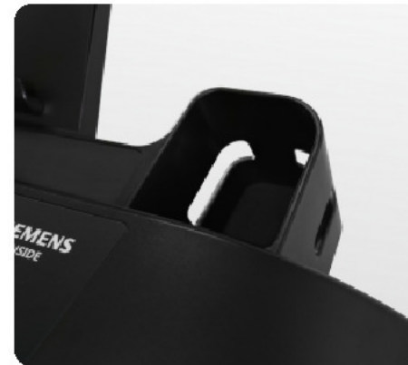
Подставка под бутылку