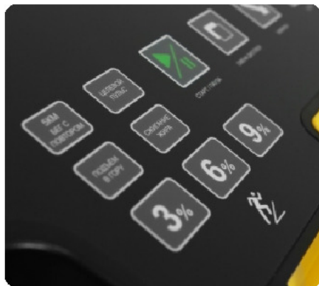
Русифицированные сенсорные кнопки управления