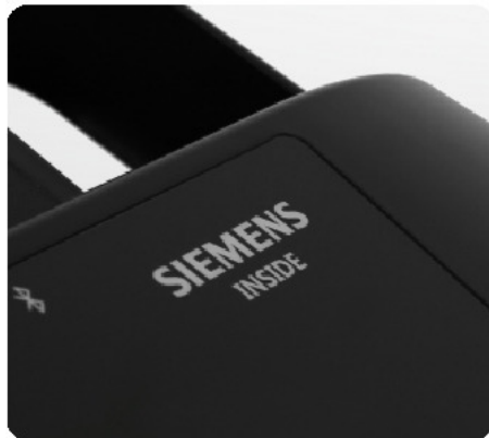
Обозначение Siemens Sinamics V20