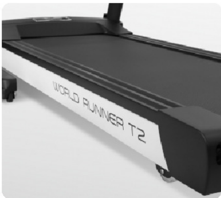
Профессиональная рама закрытого типа Shield Deck™ Pro