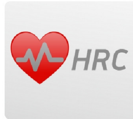
Встроенный в консоль беспроводной приемник частоты сердечного пульса