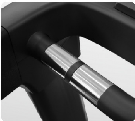
Сенсорные датчики пульса