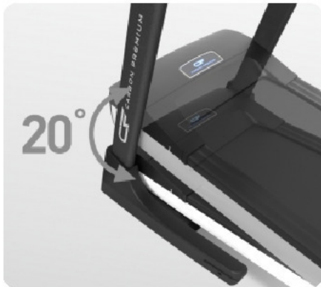
Электрически изменяемый угол наклона от 0 до 20%