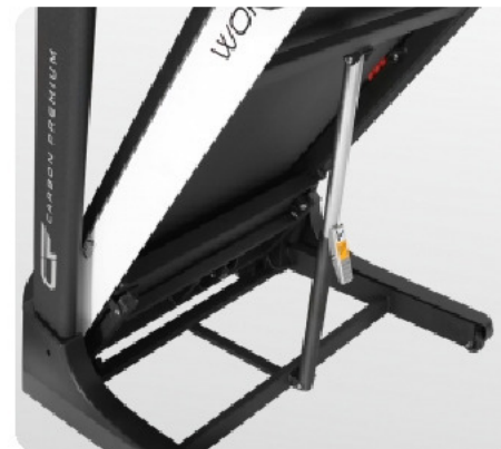
Двухфазная гидравлика Easy Drop™ Advanced