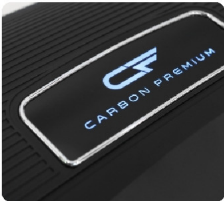
Одна из премиальных компонент - светящийся логотип CARBON PREMIUM