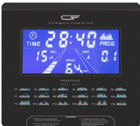
Голубой многофункциональный LCD-дисплей диагональю 7 дюймов (18 см.) с профилем тренировки