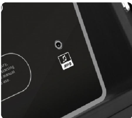
AUX-разъем для воспроизведения музыки с мобильных устройств