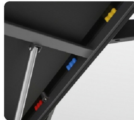
Профессиональные динамические амортизаторы ABS™ Pro и 2 динамических эластомера VCS™