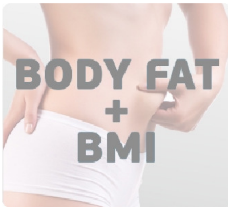
Жироанализатор (Body Fat) и индекс массы тела (BMI)