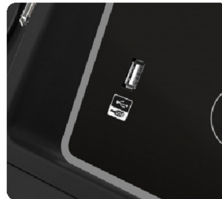
USB-разъем для воспроизведения аудио и зарядки мобильных устройств