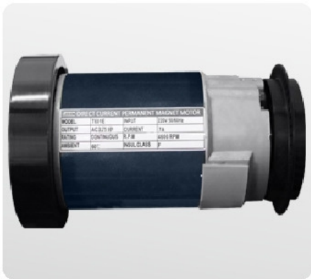
Надежный двигатель американской компании Leeson мощностью 3.75 л.с.