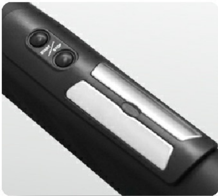
Рукоятки с сенсорными датчиками и "быстрыми" кнопками