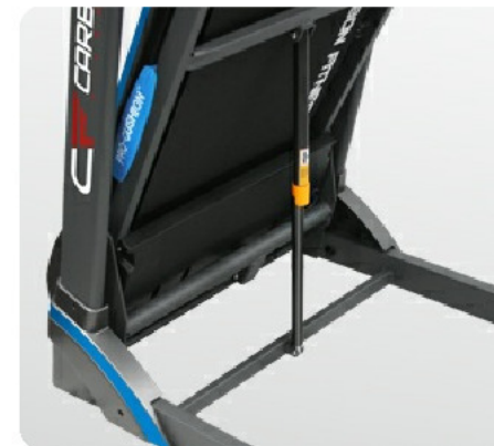
Двухфазная гидравлика Easy Drop™