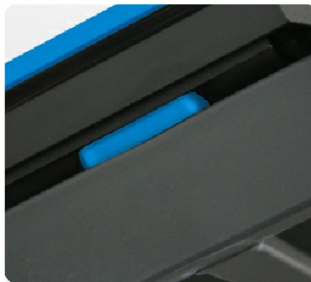
Дополнительные стабилизирующие эластомерные блоки Guard-Rail™