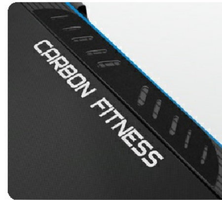
Антискользящие накладки для ног на боковых направляющих