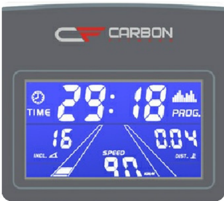
Голубой многофункциональный LCD дисплей с диагональю 4.9 дюйма (12.5 см.)