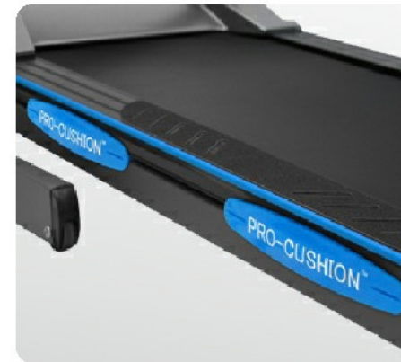
4 суперподушки Pro-Cushion™ для бережного отношения к суставам