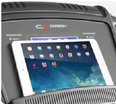
Подставка под планшет