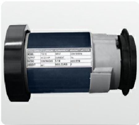
Надежный двигатель американской компании Leesop мощностью 2.5 л.с.