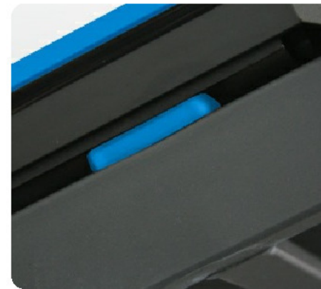
Дополнительные стабилизирующие эластомерные блоки Guard-Rail™