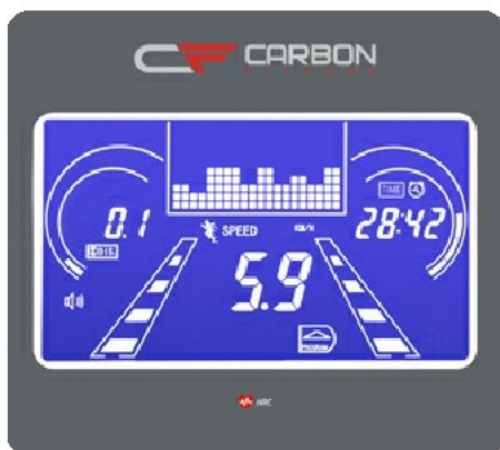
Голубой многофункциональный LCD дисплей с диагональю 4.9 дюйма (12.5 см.)