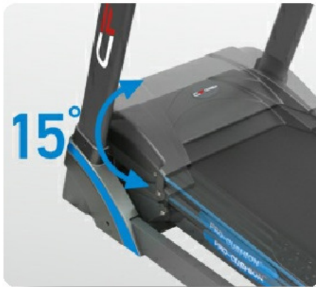
Электрически изменяемый угол наклона от 0 до 15%