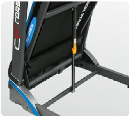
Двухфазная гидравлика Easy Drop™