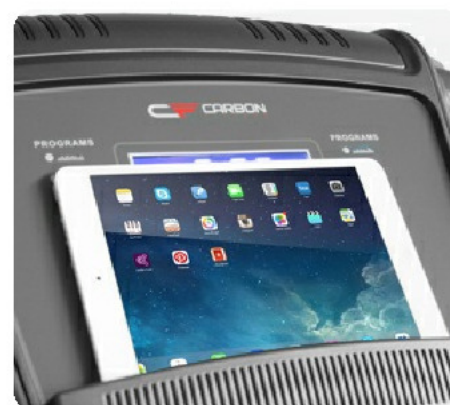
Подставка под планшет