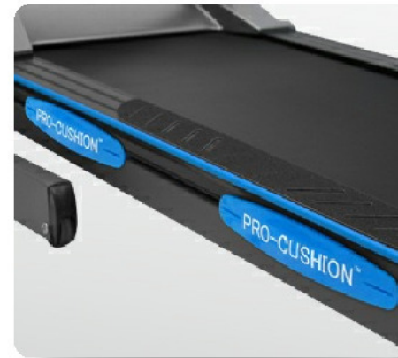
4 суперподушки Pro-Cushion™ для бережного отношения к суставам