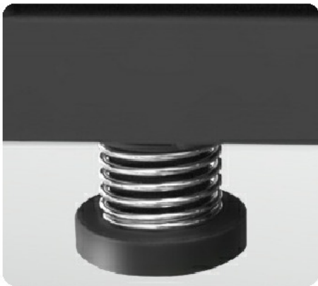
Цилиндрические эластомеры с пружинами Soft Springs™