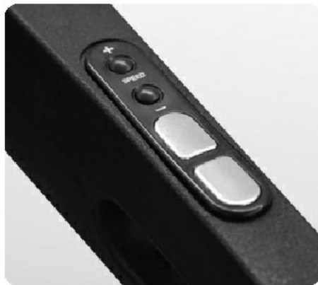
Рукоятки с сенсорными датчиками и "быстрыми" кнопками