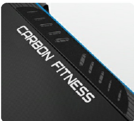
Антискользящие накладки для ног на боковых направляющих