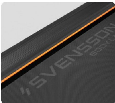
ДВУХСЛОЙНОЕ БЕГОВОЕ ПОЛОТНО ТОЛЩИНОЙ 1,8 ММ