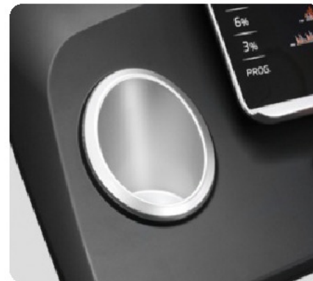
ДЕРЖАТЕЛИ ДЛЯ ЕМКостей