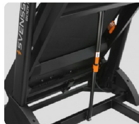
ГИДРАВЛИЧЕСКОЕ СКЛАДЫВАНИЕ SOFT-DROP™