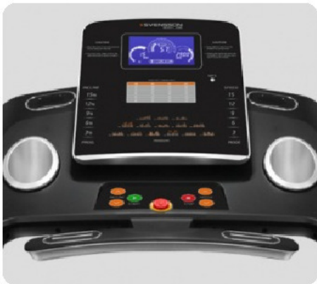
ГОЛУБОЙ LCD-ДИСПЛЕЙ ДИАГОНАЛЬЮ 18 СМ