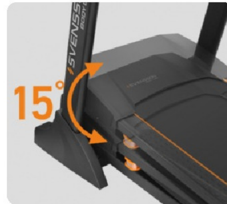
ЭЛЕКТРИЧЕСКАЯ РЕГУЛИРОВКА УГЛА НАКЛОНА 0-15%