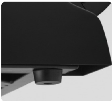
КОМПЕНСАТОРЫ НЕРАВНОСТЕЙ ПОЛА