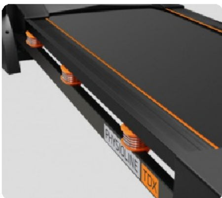
Силикон-гелиевые подушки с пружинами physio-Run™