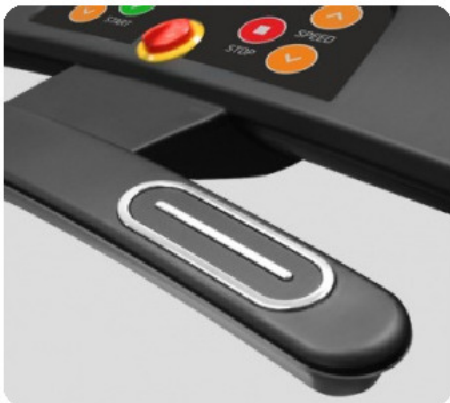
СЕНСОРНЫЕ ДАТЧИКИ ПУЛЬСА