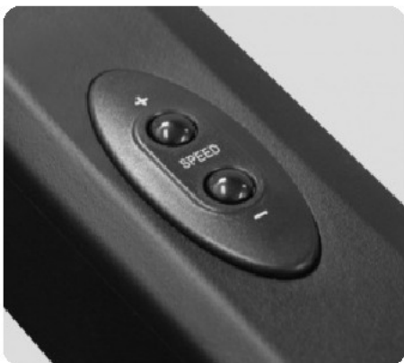
КЛАВИШИ УПРАВЛЕНИЯ НА ПОРУЧНЯХ КОНСОЛИ