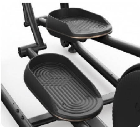
Рифленые педали увеличенного размера