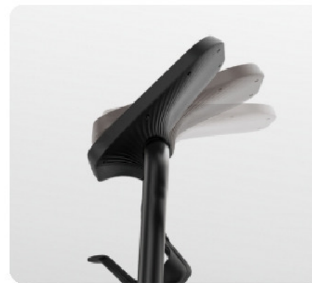
Регулируемая консоль для оптимального обзора