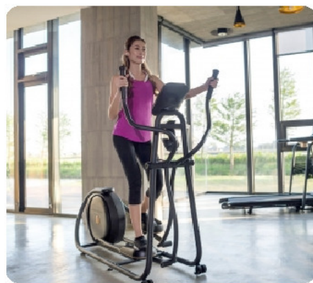
Эллипс идеально впишется даже в небольшое помещение благодаря уникальному минималистичному дизайну