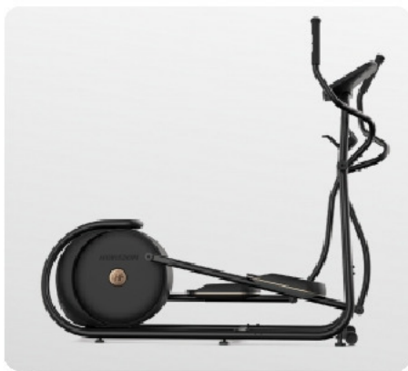
Стильный, "легкий" дизайн с технологией "парящих" педалей