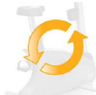
Независимость от электросетей для экономии электроэнергии и оптимального расположения