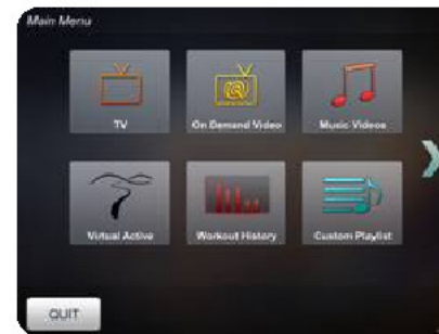
WEB on-line фитнес ориентированный мультимедийный сервис Netpulse.com (требуется дополнительное оборудование)