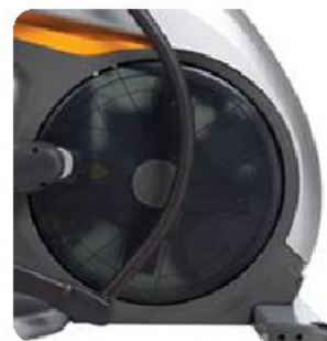
Съемная крышка маховика и ряд других улучшений для быстрого сервисного обслуживания