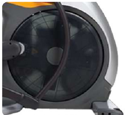
Съемная крышка маховика и ряд других улучшений для быстрого сервисного обслуживания