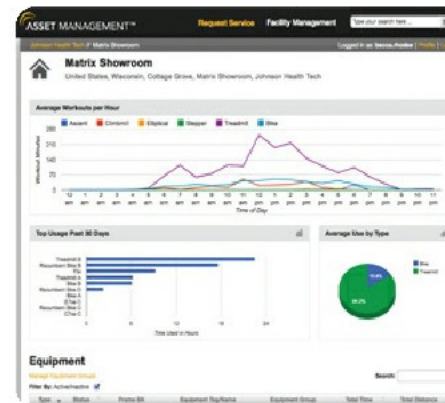
WEB интерфейс Ass et Management™ выводит массу различных эксплуатационных показателей, полезных как для управляющего клубом, так и сервисной службы