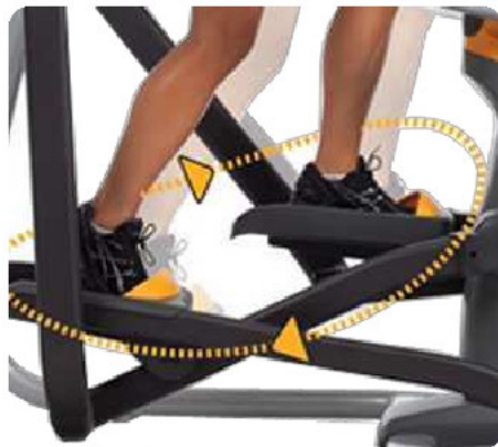
Разработанная Институтом Купера траектория Bioradius Perfect Stride™ для наилучшего аэробного результата