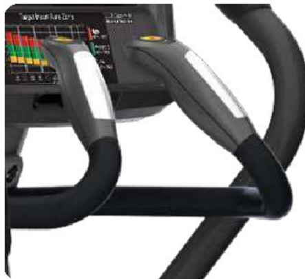
Контурные эргономичные рукоятки с датчиками пульса и клавишами управления для большего комфорта