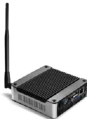
Внешний роутер Matrix Asset Management™ для сбора и анализа данных состояния оборудования в режиме on-line