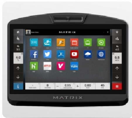
16-ти дюймовый сенсорный тач TFT-LCD дисплей Vista Clear™ на ОС Android с Wi-Fi доступом к различным интернет приложениям