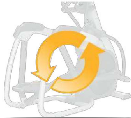
Независимость от электросетей для экономии электроэнергии и оптимального расположения