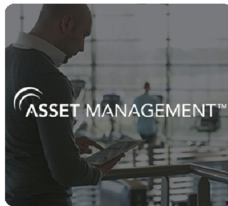
Доступ в кабинет управления Asset Management™ с консоли либо мобильного устройства