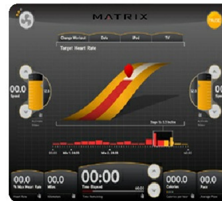
Элемент пользовательского программного интерфейса