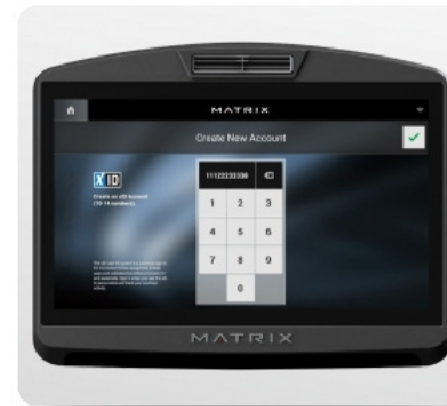
xID - личная учетная запись для мониторинга статистики тренировок