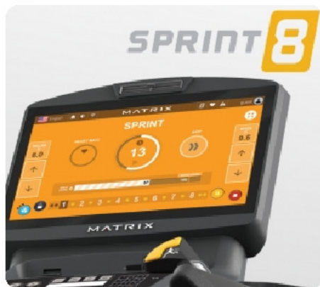
SPRINT 8 - научно-разработанная программа для высокоинтенсивных интервальных кардио тренировок (ВИИТ)