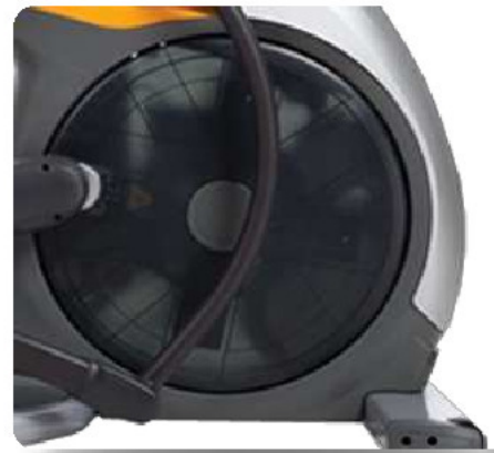
Съемная крышка маховика и ряд других улучшений для быстрого сервисного обслуживания