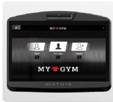
Брендирование интерфейса под свой клуб