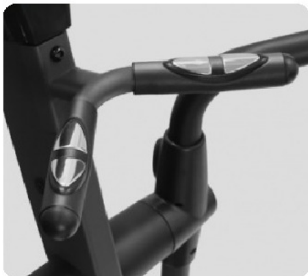
СЕНСОРНЫЕ ДАТЧИКИ ПУЛЬСА