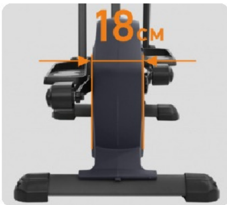
ЗАУЖЕННОЕ РАССТОЯНИЕ МЕЖДУ ПЕДАЛЯМИ (18 CM)