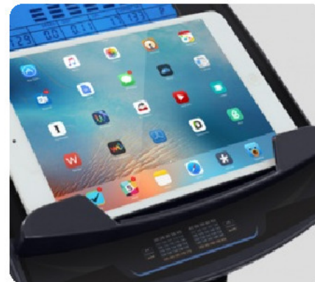
ПОДСТАВКА ПОД ПЛАНШЕТ ИЛИ СМАРТФОН