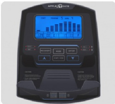
ГОЛУБОЙ LCD-ДИСПЛЕЙ 14 CM