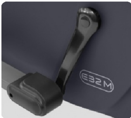
ТРЕХКОМПОНЕНТНЫЙ ПЕДАЛЬНЫЙ УЗЕЛ