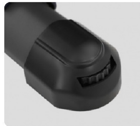
КОМПЕНСАТОРЫ НЕРОВНОСТЕЙ ПОЛА