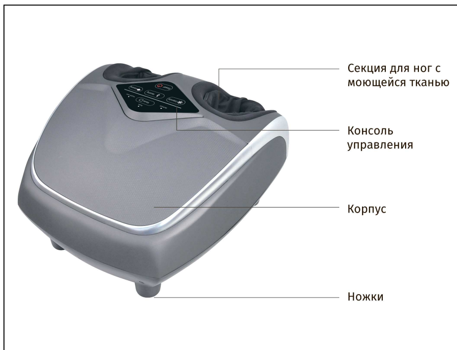
Рисунок 1 – Устройство универсального портативного массажера