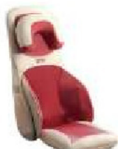
OTO Back Sniggle