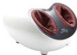
OTO Adore Foot