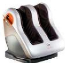
OTO Activ Foot