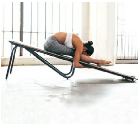
Выполнение традиционных упражнений с максимальной амплитудой