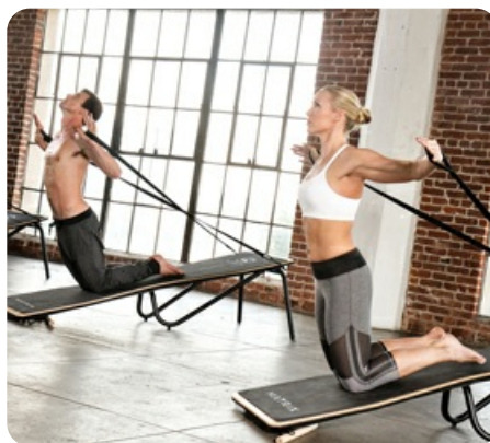
Присоединяемые ремни служат продолжением платформы и удерживают пользователя в любом положении