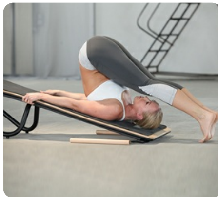
Отрицательный наклон платформы меняет привычную нагрузку