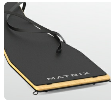
Съемный коврик легко снимается и может быть использован на ровном полу