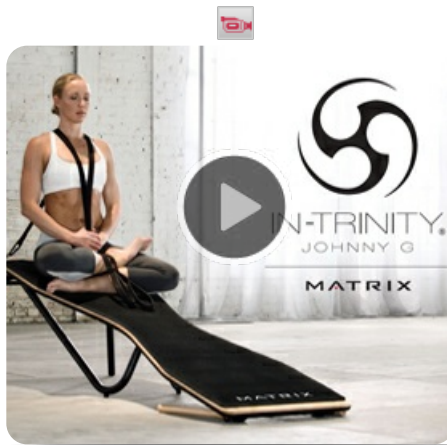
Видео о наклонной платформе для группового и функционального тренинга In-Trinity