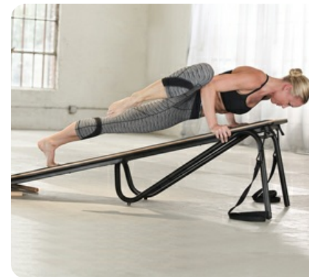
Положительный наклон платформы включает в работу дополнительные мышечные группы