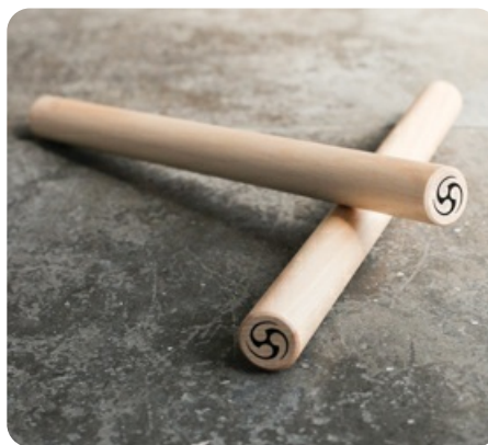
Деревянные палочки для дополнительной нагрузки