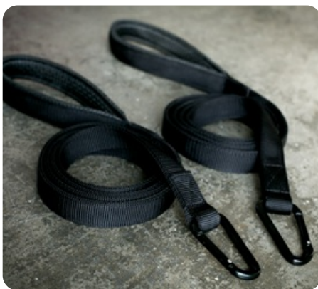
Присоединяемые к доске ремни из сверхпрочного материала с карабинами и мягкими, эргономичными ручками

Теги: Групповой тренинг функциональный и групповой тренинг , Доски In-Trinity™ функциональный и групповой тренинг , Функциональный и групповой тренинг Matrix