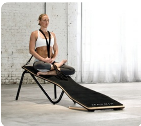
Форма платформы в виде песочных часов обеспечивает комфортное нахождение на поверхности и сверхмаксимальную амплитуду при выполнении упражнений